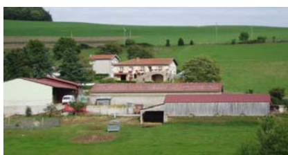
Identifier son exploitation par l'approche système

Celle-ci a permis de faire expérimenter aux éleveurs des outils d'animation innovants, qui les ont aidés à clarifier leur projet personnel et professionnel dans une période de crise.