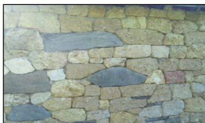
« Pour être complémentaires, soyons différents ! »

Cela contribue dans la structure à montrer que l'on peut et que l'on doit s'intéresser au facteur humain, surtout quand on fait de la technique.