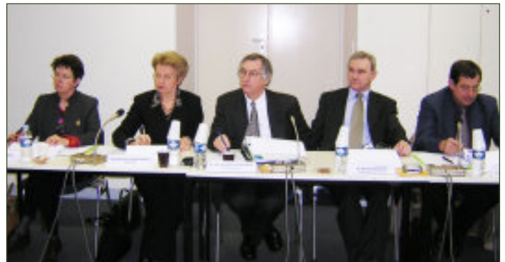
Conseil de gestion du 29 janvier

En parallèle les spécificités des chefs d'entreprise ont été prises en considération. Ils sont à la fois des entre-