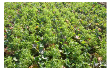
L'implantation en semis direct d'un couvert gesse + fenu grec + lentille associé au colza concurrence le développement du géranium.